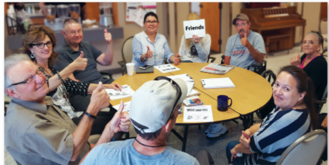
Cada semana se ofrecen grupos de conversación y numerosos grupos de intereses especiales.